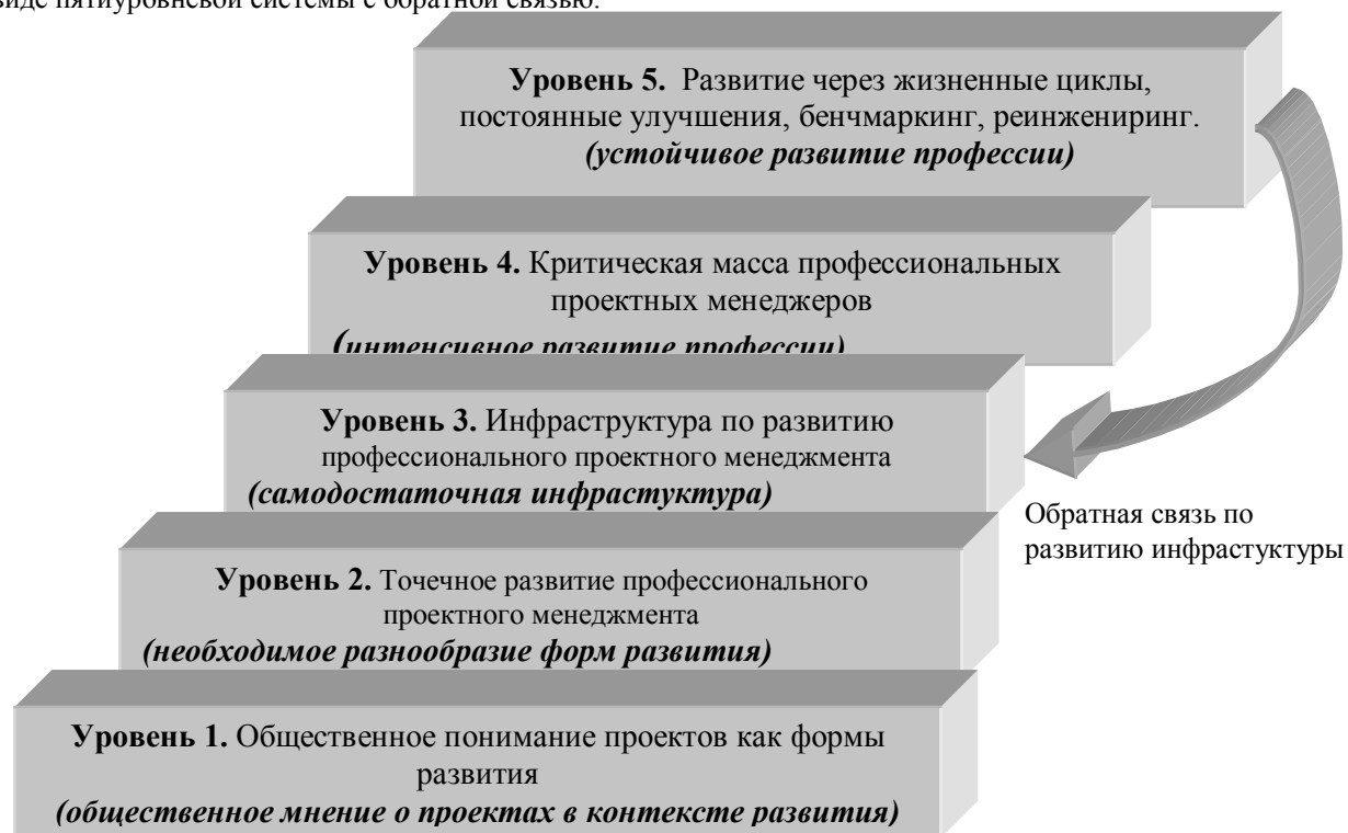
Рис. 1 Модель технологической зрелости общества в области профессионального управления проектами PMСMM

Модель технологической зрелости общества в области профессионального управления проектами PMСMM (Project Management Capacity Maturity Model), предложенная авторами, представлена на рис. 1 в виде пятиуровневой системы с обратной связью.